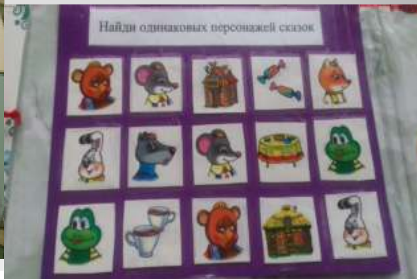
Лэпбук «Фольклор для самых маленьких»